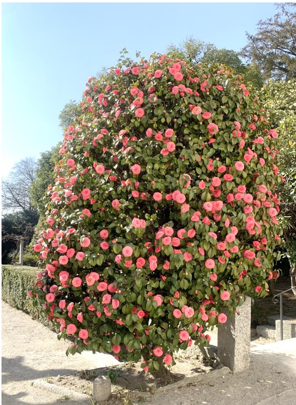
Camelia nel Parco di Casa Rusca

Coordinamento redazionale a cura della segreteria comunale di Cureglia